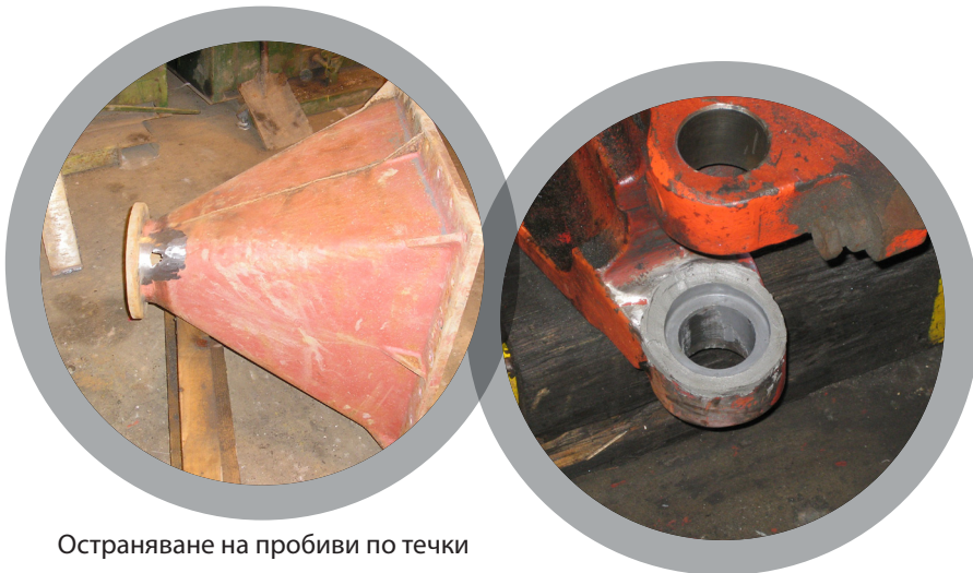
Остраняване на пробиви по течки